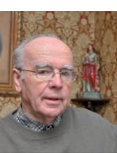
Jan Kohlbacher Stichting Erfgoed Eisden

hebben de verschillende festiviteiten tot doel de tuinwijkbewoners samen te brengen rond de viering